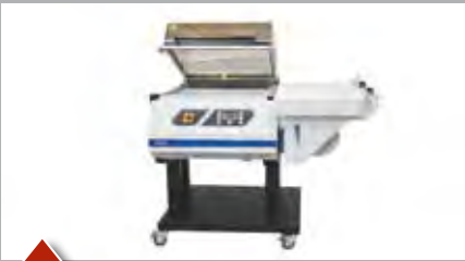
Manuell bis 10 Takte pro Minute