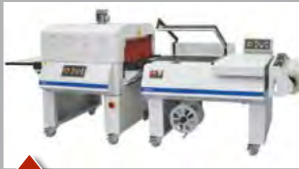
Halbautomatisch bis 30 Takte pro Minute