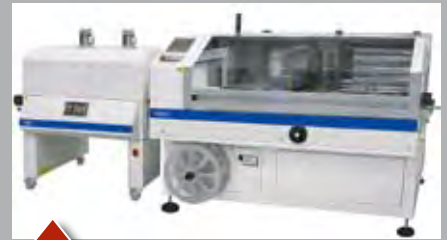
Vollautomatisch bis 100 Takte pro Minute oder höher, mit oder ohne Schumpftunnel